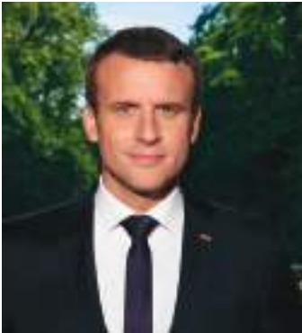
Emmanuel Macron Président de la République