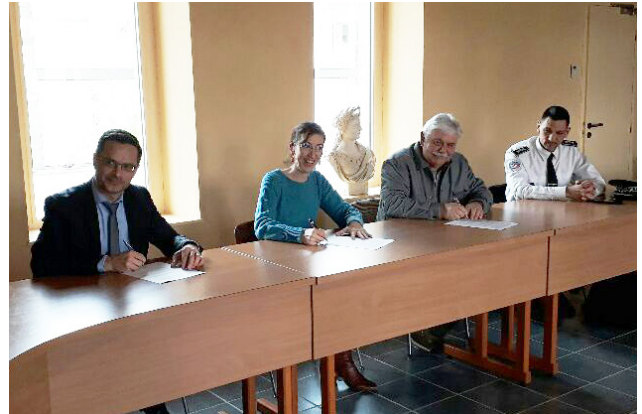
à Avermes pour la signature d'une convention communale de coordination entre la police municipale et les forces de sécurité de l'État