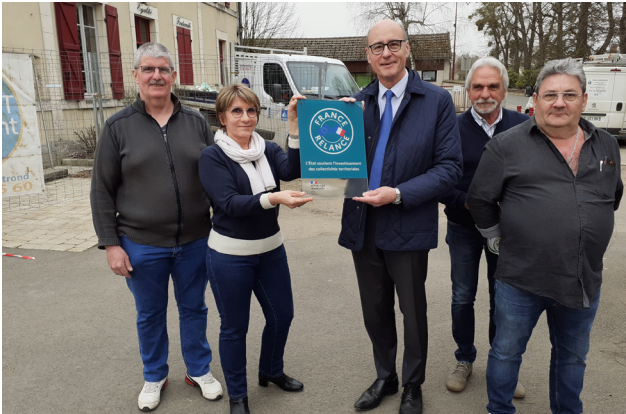
à Valignay pour la remise de la plaque France relance