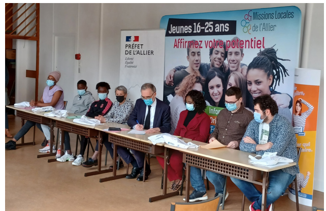
pour la signature du premier contrat d'engagement jeune