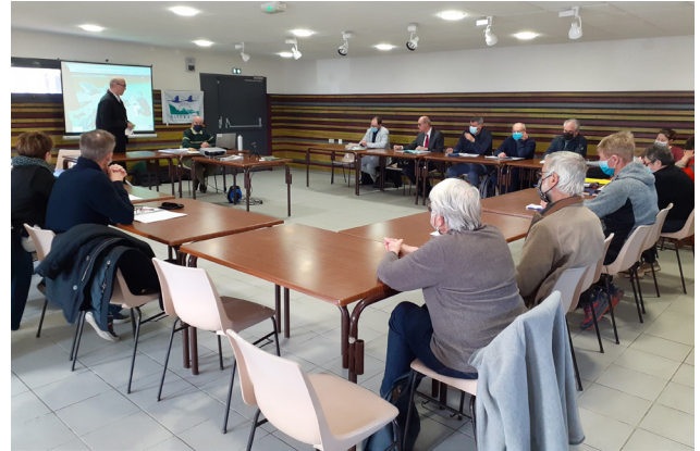
à Mazirat (site Natura 2000 des gorges du Haut-Cher)