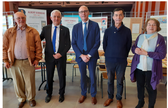
au salon du livre de Montmarault