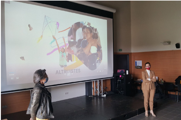
à un ciné débat à Tronget lors de la semaine de lutte pour les droits des femmes