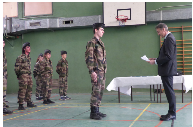
Cérémonie de clôture de la formation des cadets de la gendarmerie