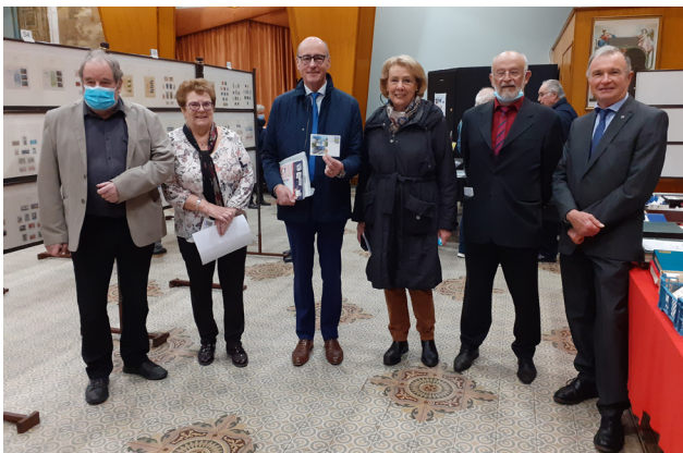
à l'exposition pour la fête du timbre à Montluçon