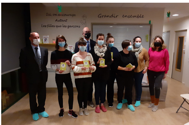
à la crèche Babilou à Montluçon