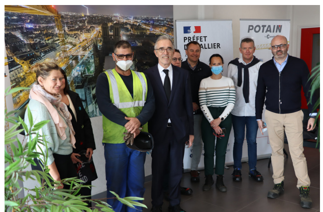
dans le processus de reclassement des salariés « post-RCEA » chez Manitowoc