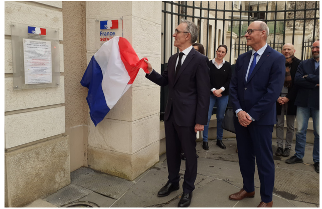
Inauguration de l'espace France Services à la sous-préfecture de Montluçon