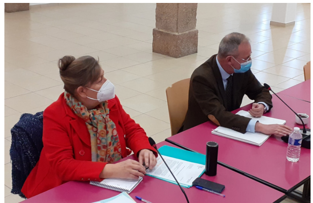
à la réunion Petites villes de demain de la communauté de communes de Lapalisse