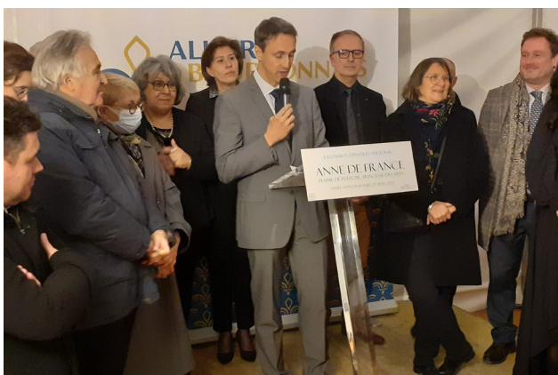
à l'inauguration de l'exposition Anne de France à Moulins