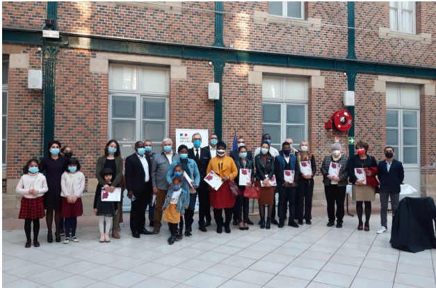
Cérémonie d'accueil dans la nationalité française à la préfecture