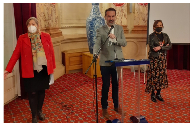
pour remercier les professionnels de santé et bénévoles du centre de vaccination de Vichy