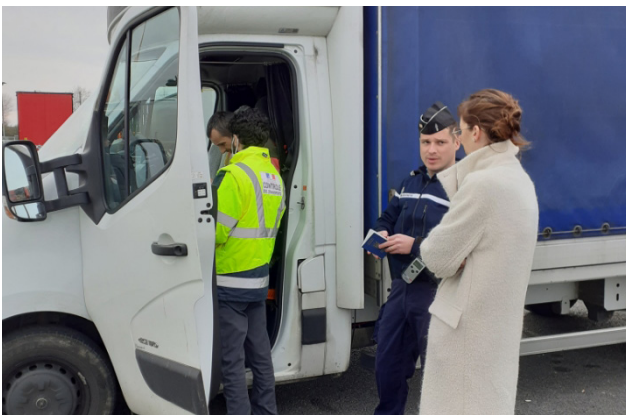
lors d'un contrôle routier poids lourds avec la Gendarmerie et la DREAL