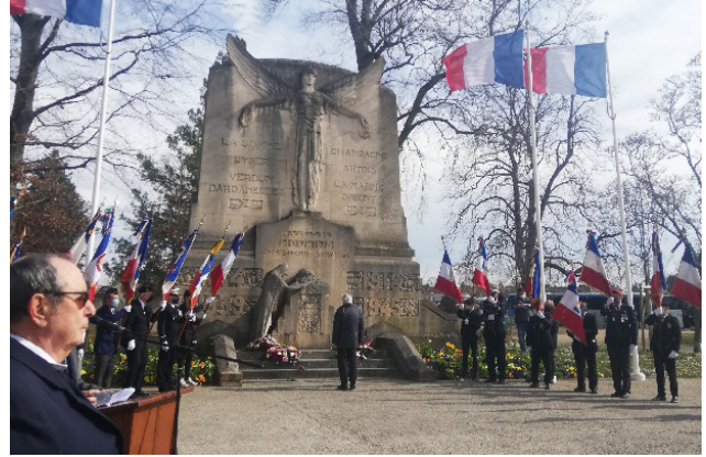
Cérémonie nationale d'hommage aux victimes du terrorisme