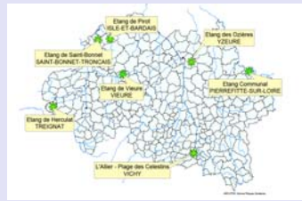
Sites de baignade naturelle aménagés et surveillés

La réglementation en vigueur prévoit la réalisation d'un prélèvement entre 10 et 20 jours avant l'ouverture de la saison, puis des prélèvements, selon une fréquence minimale bimensuelle durant toute la saison balnéaire.