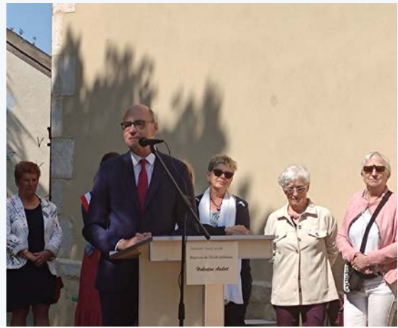
Inauguration de la passerelle à Charmeil, en présence de Véronique Beuve, sous-préfète de Vichy