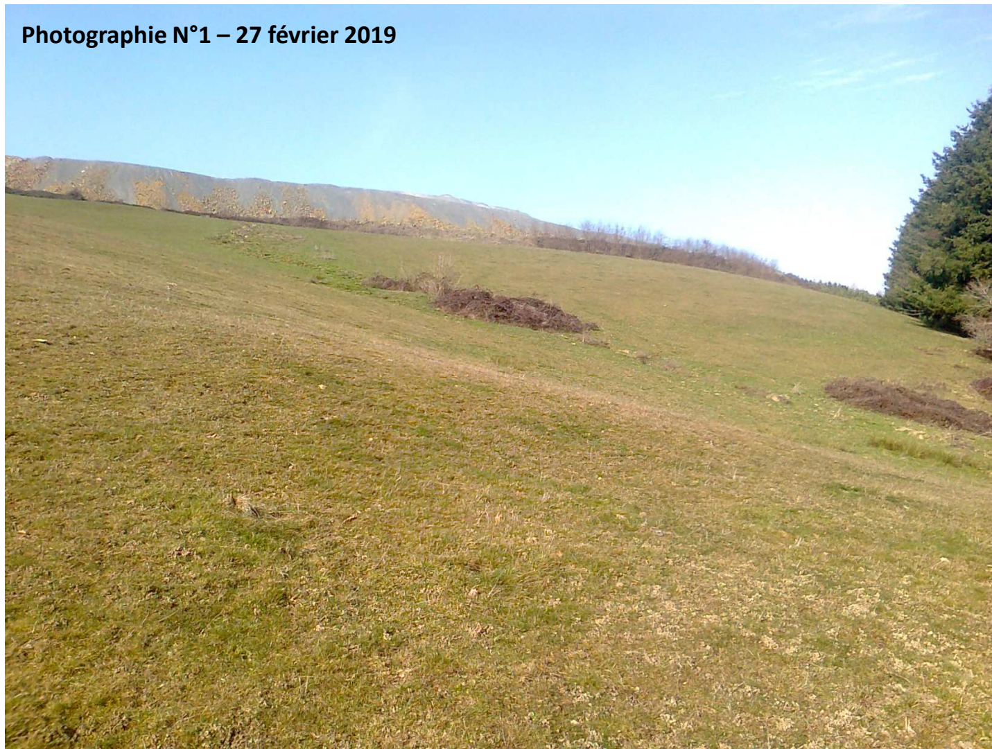
Photographie N°1 – 27 février 2019