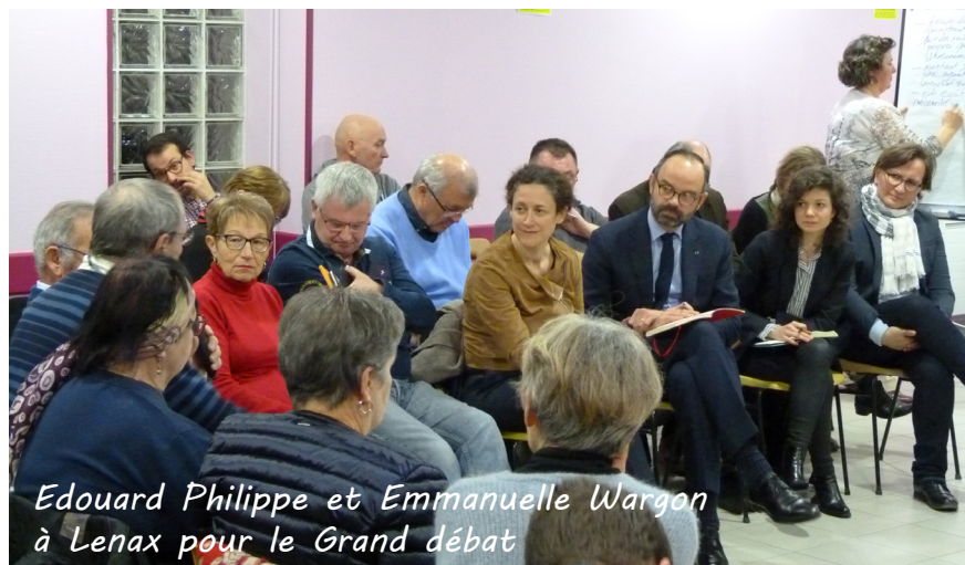
Edouard Philippe et Emmanuelle Wargon à Lenax pour le Grand débat