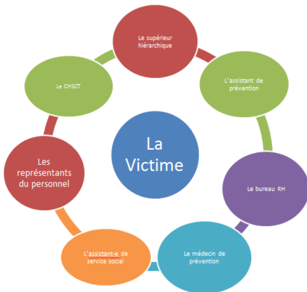
Schéma des intervenants qui peuvent être sollicités dans une situation de violence sexiste ou sexuelle.