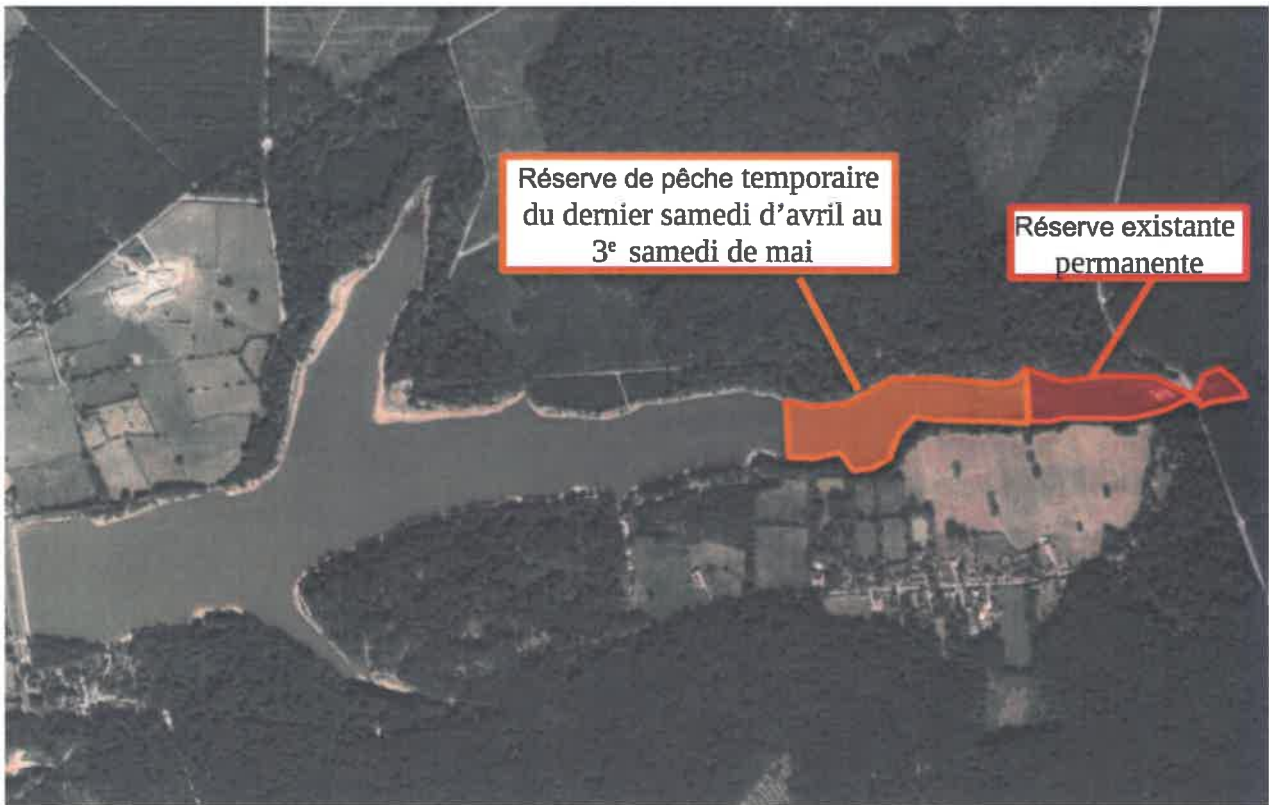
Localisation de la zone de réserve temporaire dans le prolongement de la réserve permanente