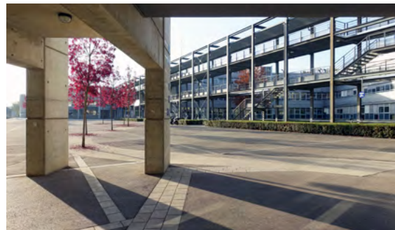
UNIVERSITÉ SAVOIE MONT BLANC TECHNOLAC BOURGET-DU-LAC (73) : 859 500 € POUR LA RÉFÉCTION ET L'AMÉLIORATION DE L'ISOLATION ET LE REMPLACEMENT DE CHAUDIÈRES GAZ PAR DES CHAUDIÈRES BOIS.

En deuxième lieu, ils permettront de soutenir les jeunes étudiants en améliorant leurs conditions de vie et de formation : 141 projets de rénovations financés en Auvergne-Rhône-Alpes concernent des universités mais également d'autres établissements de la