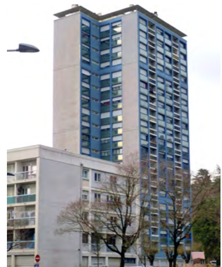
QUARTIER DE LA MÉRANDE - CHAMBÉRY (73)